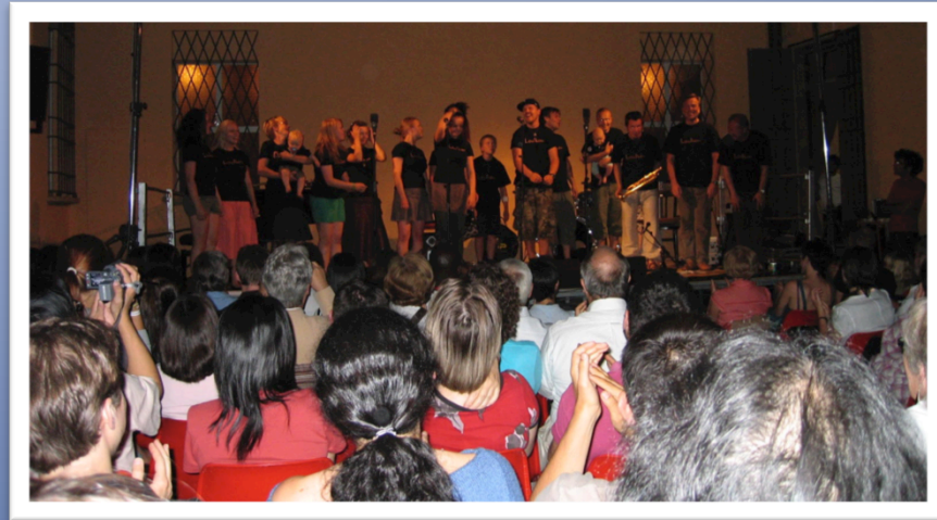
Louhikone Mozartin jalanjäljillä Bolognassa